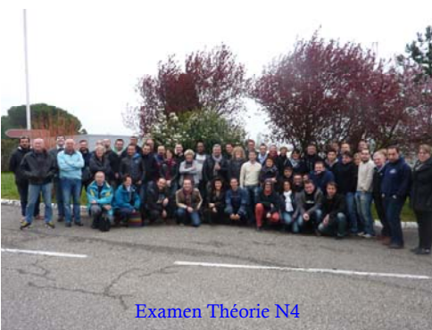
Examen Théorie N4

Vient la fin de saison, et avec elle le temps de l'évaluation.