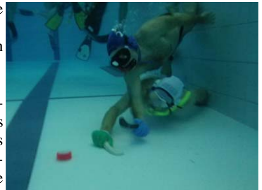
Le palet, objet de toutes les convoitises

Le message des entraîneurs a été clairement énoncé pour le groupe: