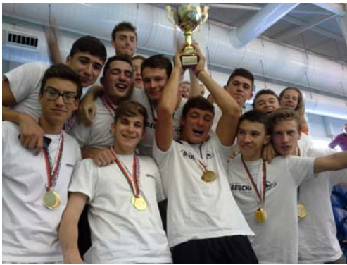
L'équipe championne d'Europe

L'objectif est de rester à cette place et de travailler afin de retrouver une place sur le podium mondial en 2015.