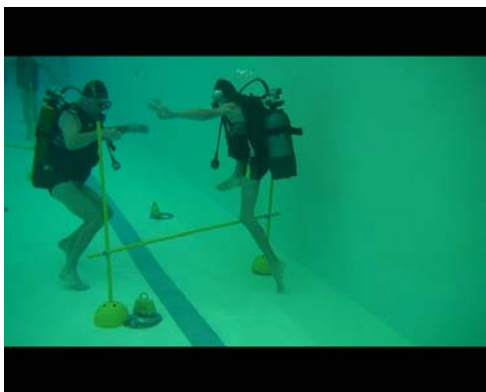
Saut d'obstacle : prise d'élan ...