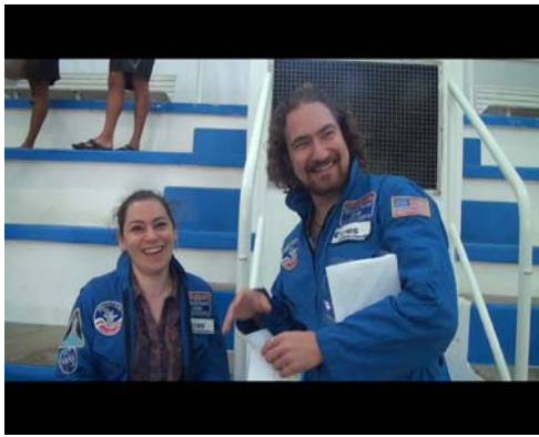
Les organisateurs de Cap Science

C AP SCIENCE a investi pour une journée la piscine municipale « Jean BADET » à MÉRIGNAC.