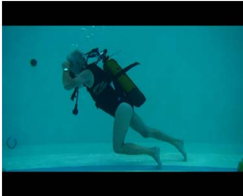
Démonstration de marche

Mais, direz vous, quel rapport avec la plongée ? CAP SCIENCE voulait proposer aux participants une expérience d'évolution en micro gravité, le milieu subaquatique étant parfait pour obtenir facilement cette sensation.