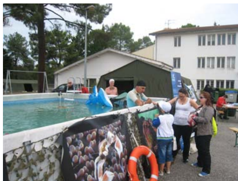
... mais il faut parfois convaincre.