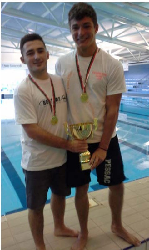
Les 2 girondins (pessacais) de l'équipe