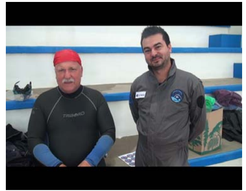
Le plongeur et le scientifique

Dès le hall d'entrée, des présentations par affiches et clip vidéo mettaient l'arrivant dans une atmosphère d'apesanteur. Un fauteuil tournant initiait le visiteur à la sensation de vertige et perte d'équilibre.