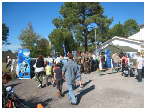
Une animation qui attire ...