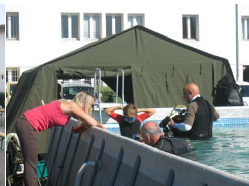
Une préparation très entourée