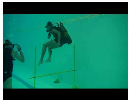
... et découverte de la faible pesanteur